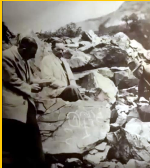
Observando petroglifos de antiguas culturas ancestrales.